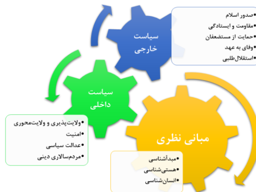
نمودار شماره ۳