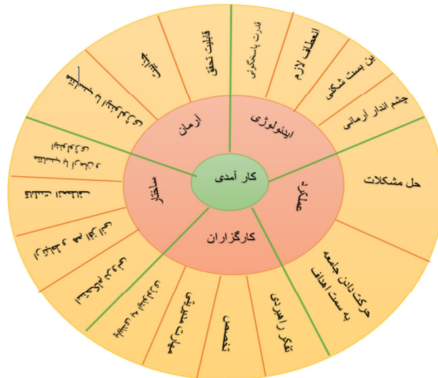
نمودار ۵. مدل کارآمدی نظام سیاسی در حکمرانی مصلحانه

ه) کارآمدی در سطح عملکردی: به گونه‌ای که هر شاهد منصفی نظام را قادر به حرکت دادن جامعه به سمت هدف‌های آن بداند. این مدل را می‌توان الگوی کارآمدی در نظام جمهوری اسلامی تلقی نمود.