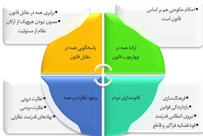
نمودار ۴. شاخص‌های حاکمیت قانون در حکمرانی مصلحانه

سوم اینکه از اختصاصات اسلام این است که مسئولان و رهبران در وهله نخست، خودشان باید بر خودشان نظارت کنند (اصول هشتاد و هفتم تا هشتاد و نهم و نودم) از این رو عنصر تقوا و عدالت اخلاقی برای رهبر و دیگر مسئولان نظام پیش‌بینی شده است.