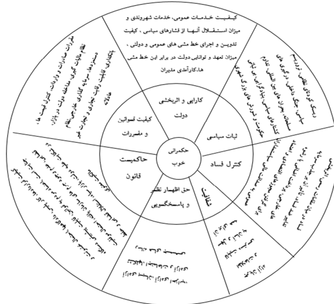
نمودار ۱. شاخص‌های حکمرانی

وجود تفاوت‌هایی که میانشان وجود دارد، منافع خود را آشکار سازند، حقوق قانونی خود را اعمال نمایند و تکالیف قانونی خود را بدانند. (UN System Task Team, 2012: 3) بر این اساس حکمرانی خوب شاخص‌هایی دارد که در مدل بیان شده‌اند: