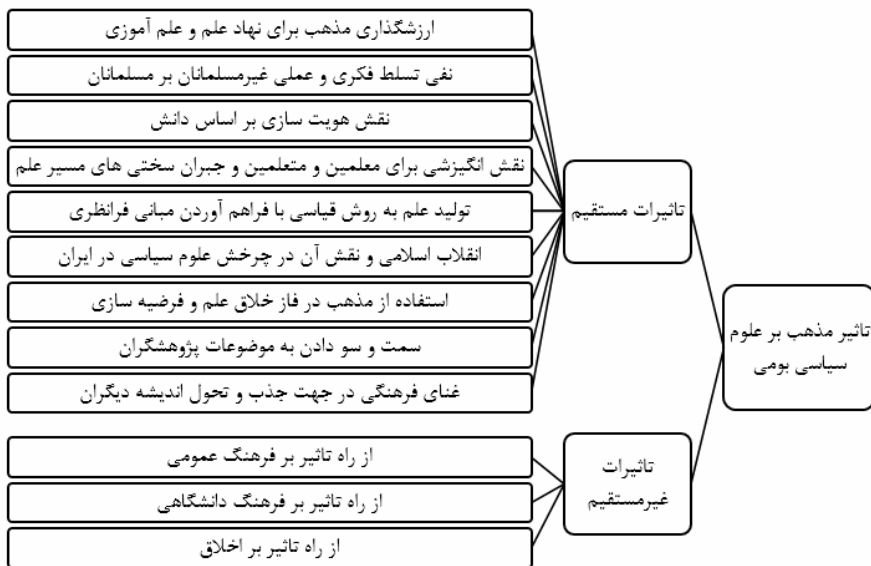
نمودار ۴: تأثیرات مذهب بر علوم سیاسی بومی