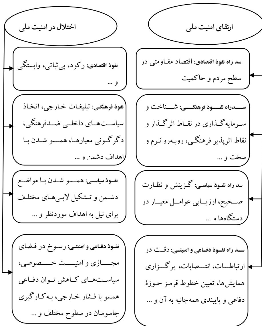
نمودار شماره ۳: راه‌های سد نفوذ در تهدیدهای امنیت