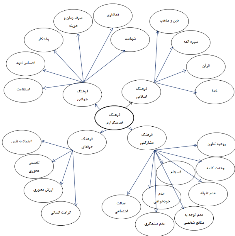
شکل ۲. شبکه مضامین فرهنگ خدمتگزاری مبتنی بر وصیت‌نامه الهی - سیاسی امام خمینی علیه السلام

در ادامه، به منظور تدوین مدل فرهنگ خدمتگزاری در اندیشه امام خمینی علیه السلام ، شبکه مضامین به همراه جدول‌های کامل کدهای باز، مضامین پایه و سازمان دهنده با عنوان پرسش‌نامه، به خبرگان ارائه شد تا دیدگاه‌های خود را راجع به دسته‌بندی‌های صورت گرفته از "کاملاً اصولی" تا "غیراصولی" بیان کنند. تأیید یا عدم تأیید این کدها و مضامین با استفاده از آزمون دو جمله‌ای در نرم‌افزار SPSS صورت گرفت. اگر عدد معناداری (Sig)، با نقطه برش ۳/۵، بزرگ‌تر یا مساوی با ۰/۰۵ به دست آمد، آن کد را تأیید نشده در نظر گرفتیم. شایان ذکر است، تمام عددهای معناداری (Sig) مرتبط با مضامین پایه در ناحیه قابل قبول قرار گرفتند و به این ترتیب، کلیت مدل ارائه شده (مضامین پایه و سازمان دهنده) مورد تأیید قرار گرفت.