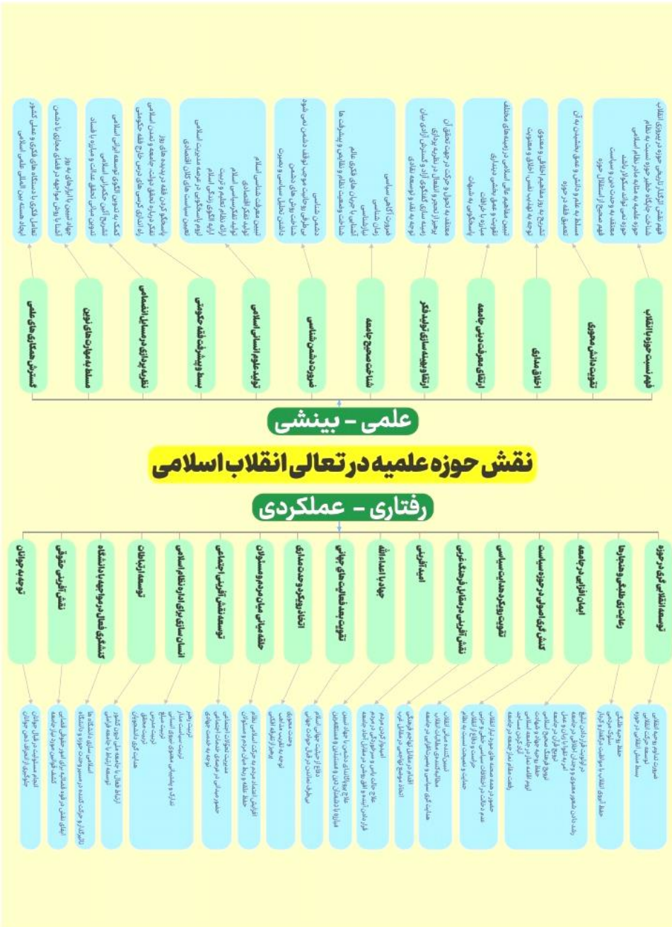
شکل ۱- مدل شبکه مضامین مبتنی بر بیانات رهبر انقلاب اسلامی